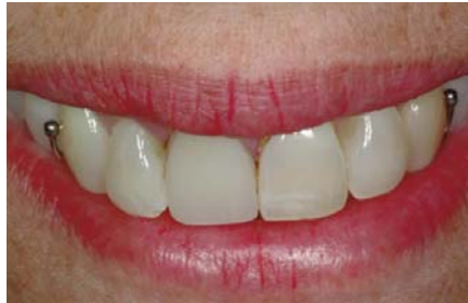
Sobredentaduras parciales removibles