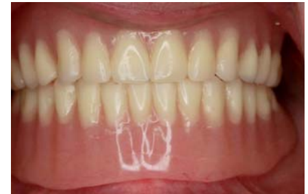
Prótesis totales o dentaduras completas